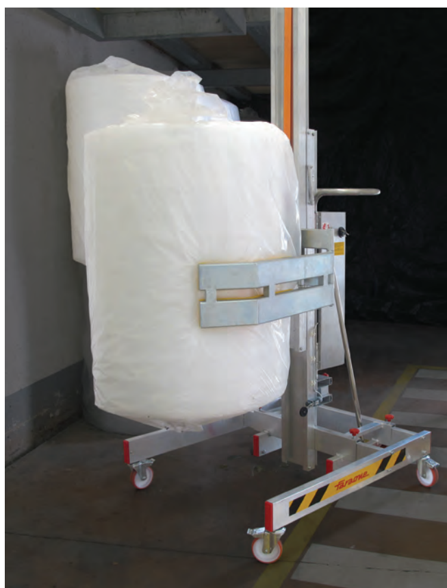
HW BIG z HW.PI, szczypce hydrauliczne do podnoszenia szpul. HW BIG with HW.PI, hydraulic gripper for lifting reels.